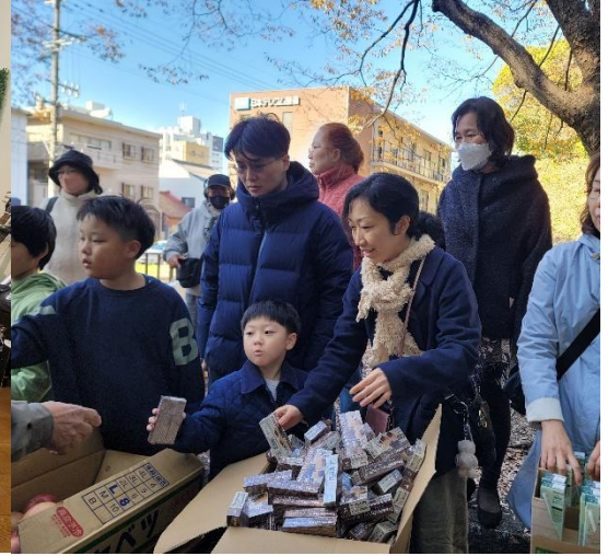
(사진 2) 추수감사절 전교인 노숙자 섬김