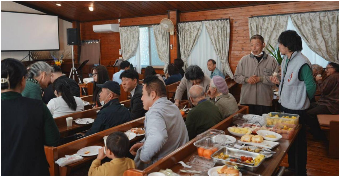
(사진 17) N교회 아웃리치

“N교회에 다녀온 후, 하나님께서 왜 우리를 이 자리에 불러주셨는지 알게 되었어요. 그리고 우리 공동체가 얼마나 건강한지 깨달았습니다. 비록 우리는 임대 사무실에서 예배하지만, 우리 예배처에 더 깊은 정과 사랑을 느끼게 되었습니다.” (일본인 교인 G, 면접)