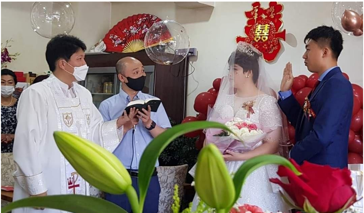
(사진12) 2022년 중국인 교인 N 혼인식

이 외에도 학생들의 학년이 바뀌게 되는 4월의 진학식(進學式)이나, 5월의 어머니의 날, 6월의 아버지의 날, 11월의 경로의 날 등 전통적 교회 절기 행사와 관련이 없는 일본의 경축일이나 문화 행사를 교회에서 적극적으로 준비하고 지역 사회와 함께 기뻐하는 등 일본의 문화와 절기행사를 사용하여 그들의 문화 가운데 복음을 소통한다. 또한 일본 사회안에서 이민자로 살아가는 재일(在日)중국인을