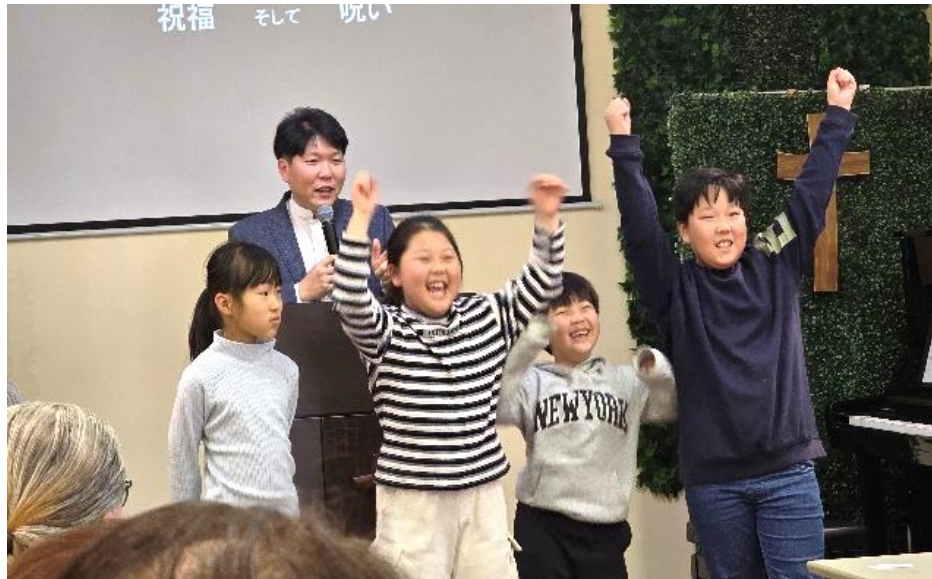
(사진 15) Family Worship 어린이들 예배 참여