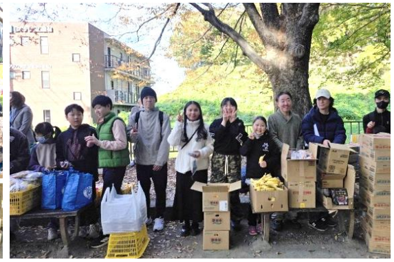
(사진 4) 추수감사절 전교인 노숙자 구호물품