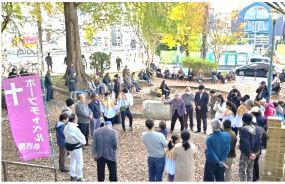
(사진 3) 추수감사절 전교인 노숙자 예배