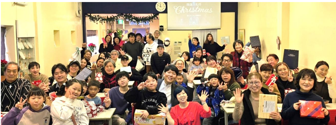
(사진 21) 크리스마스 선물 교환식

교회력에 따른 절기 때에는 메시지뿐 아니라 모임 공간의 물리적 분위기 자체가 그 절기의 의미를 말하도록 한다. 성탄절에는 크리스마스 트리와 조명 장식은 물론, 참석자 모두가 크리스마스 액세서리를 착용하며 선물을 준비하여 예배에 참석한다. 손에 들고 온 선물은 황금과 유향, 몰약을 준비한 동방 박사의 이미지를, 또한 선물 교환을 통해 나눈 선물은 우리에게 선물로 오신 그리스도를 시각적으로 전달한다.