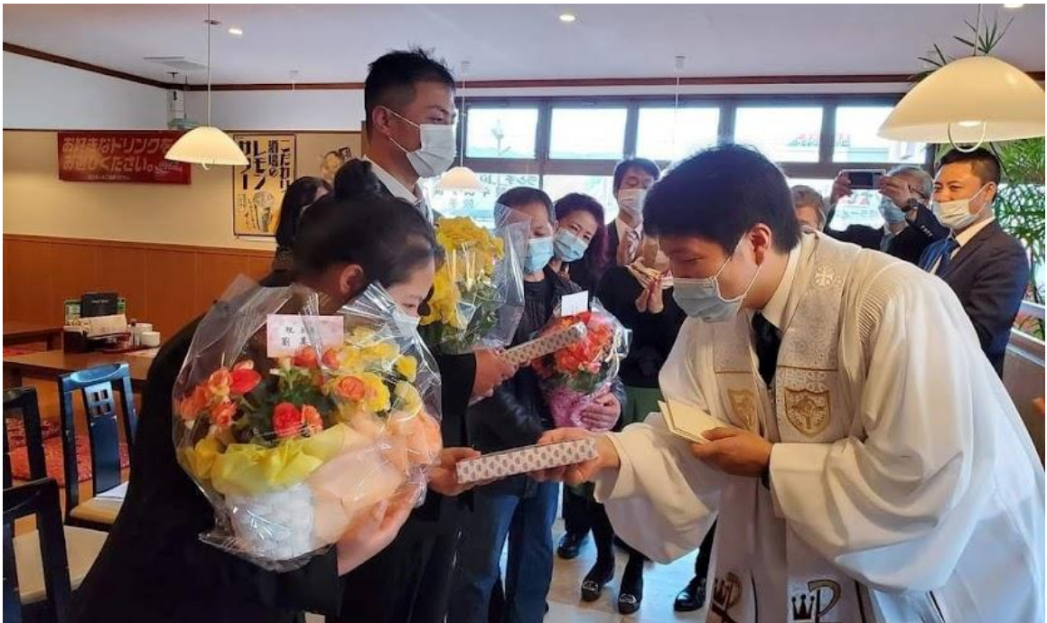
(사진13) 미에현에서의 교회 밖 세례식

셋째, 물리적 경계를 넘어서는 성육신적 확장이다. AICC의 성육신적 접근은 교회 건물을 넘어 물리적 거리로까지 확장된다. 차로 약 2시간 거리의 미에(三重) 지역에는 중국인 이민자들을 위한 교회가 없었다. AICC는 교역자와 장로, 통역자가 주 1회 이 지역을 방문하여 중국 식당 종업원들의 휴식 시간에 성경 공부를 제공했다. 세례를 원하는 세 명이 나타났을 때, 3개월간의 세례 교육 후, 교인들은 연차를 내어 함께 미에 지역으로 가서 세례식을 거행하고 잔치를 베풀었다. 교회 건물을 떠나 그들의 장소로 나아간 것이다.