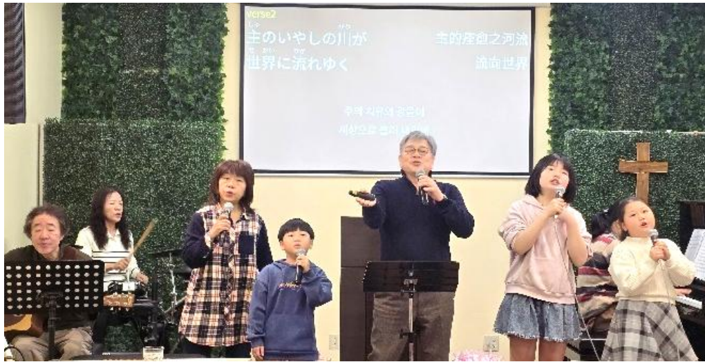
(사진 14) Family Worship 찬양 시간