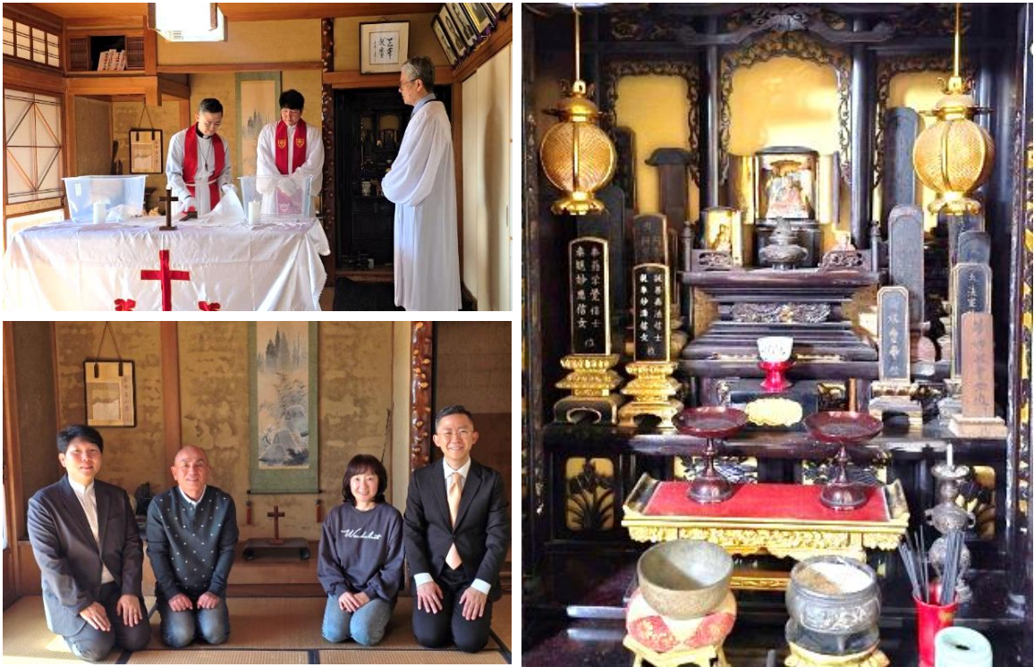
(사진 11) 좌측위의 카미다나(神棚)와 부츠단(仏壇)을 정리하는 새출발 감사예배