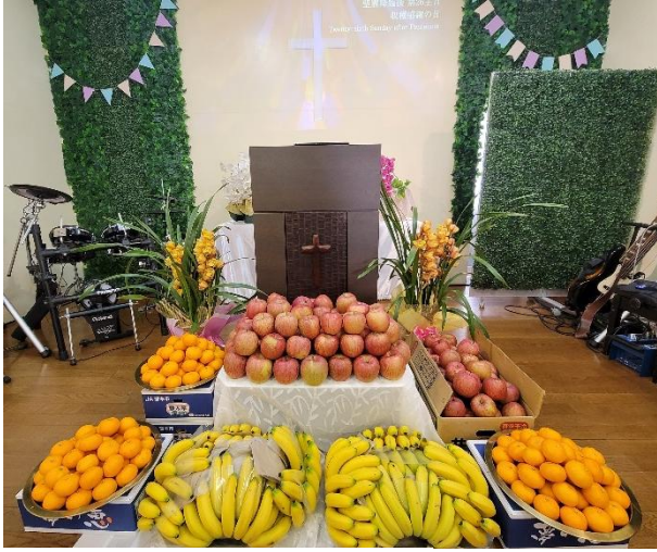
(사진 1) 추수감사절 봉헌된 과일

AICC의 선교적 실천은 구체적으로 다음과 같이 나타난다. 첫째, 의도적 자원 배분의 전환이다. 교회는 5년간 예배 장소를 교인 수 대비 협소한 대여 사무실 공간으로 유지하면서, 상당한 재정과 인적 자원을 지역 사회 섬김에 할당하였다. 특정 '우편번호' 구역 내 청소 활동, 코로나19 시기 마스크 지원, 노숙자 환경 개선을 위한 예배 및 물품 지원 등이 대표적이다. 특히 추수감사절에는 봉헌된 과일과 헌금으로 마련한 겉옷, 식료품을 노숙자들과 나누며, 이 모든 활동을 '섬김의 훈련'으로 개념화한다.