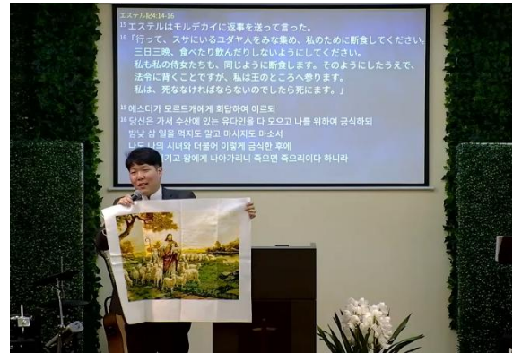
(사진19) 자수의 뒷면 실타래처럼 보이는 인생 (사진20) 인생 이면에 하나님의 완벽한 그림