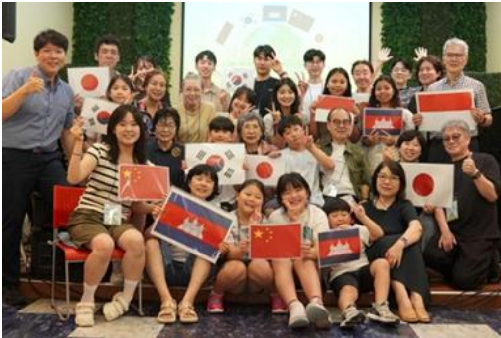
(사진 16) 국제식탁교류회

‘국제식탁교류회’는 많은 방문자들에게 큰 호응을 얻었고, AICC 교인들도 자신감을 얻어 그 후로도 ‘국제식탁교류회’ 지속되었다. 이러한 성공은 교인들에게 자신감을 부여했고, 이 경험은 교회 밖 선교로의 참여로 확장되는 계기가 되었다.