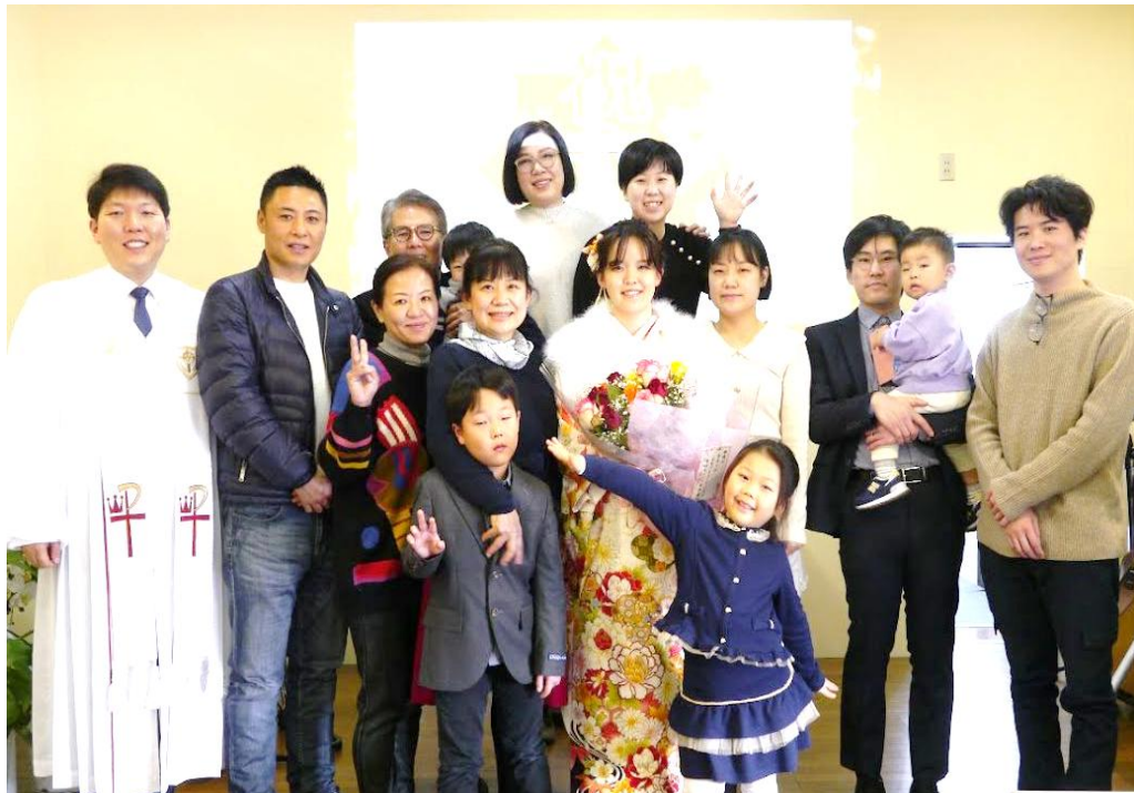
(사진 9) 2022년 성인식

이러한 인식은 일본의 문화적 절기와 의례에 대한 새로운 접근으로 이어졌다. 매년 1월 10일이 되면 일본은 20살을 맞이한 청년들이 성인식을 매우 성대하게 거행한다. 결혼식만큼이나 중요한 관혼상제이기 때문에, 고가의 전통적 의상을 착용하고, 온 친지족들의 축하를 받는 날이다. 다만 성인식을 거행하는 장소가 신사(神社)인 점을 고민하는 성도에 대해, AICC는 교회 예배처를 성인식 공간으로