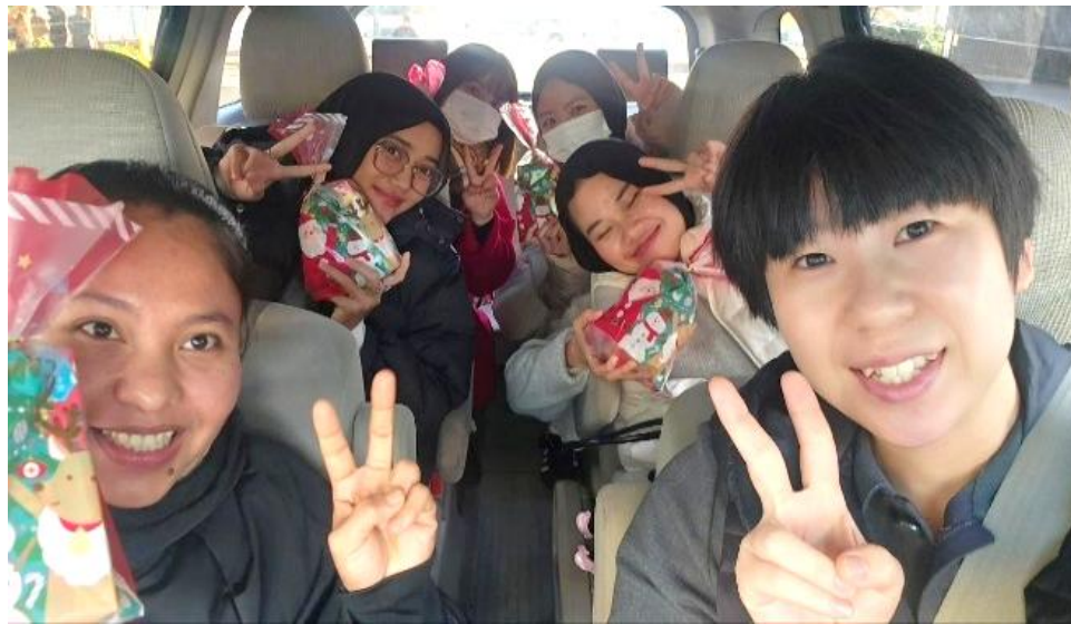
(사진 6) 일본어능력시험장 차량지원

기능실습생이 일본에서 장기적으로 정착하기 위해서는 일본어능력시험을 합격해야만 한다. AICC는 일본어능력시험 응시를 위한 차량 지원까지 아끼지 않는다. 시험날이면 교회 등록, 출석여부를 가리지 않고 시험 당일 날 기숙사에서 시험장까지 차량지원을 한다. 이는 기능실습생 내에서도 기독교라는 소수자로 살아가는 이들을 위한 배려이다. 타지에 온 외국인 노동자들 사이에서도 종교가 다르다는 이유로 기독교인은 배척 받고 따돌림 받는 것이 현실이다. 그러나 이러한 섬김을 통해, 그들이 비난하던 기독교인으로 인해 편의 혜택을 누리게 된다. 이러한 섬김은 단순한 복지 제공을 넘어, 기독교인이 소수자로서 살아가는 이들을 지지하고 그들의 삶의 현장에서 복음을 살아낼 수 있도록 돕는 선교적 실천이다.