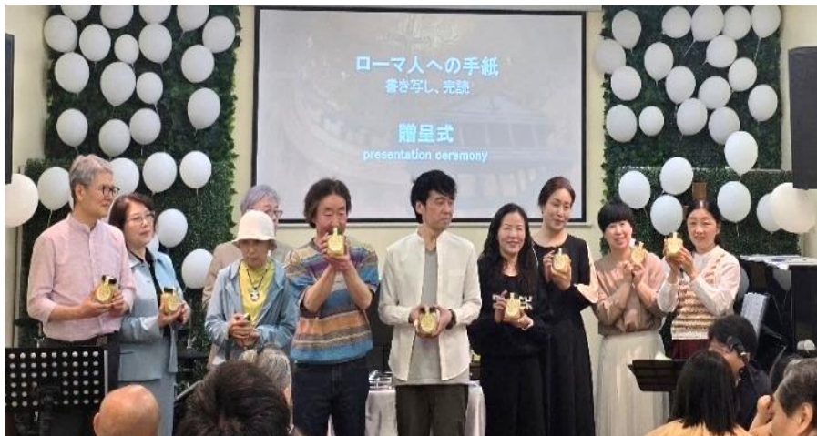
(사진 22) 부활 주일 예배당을 장식한 하얀색 풍선

이러한 이미지 중심적 접근은 언어적 장벽을 넘어 보편적 소통을 가능하게 할 뿐 아니라, 해당 문화권의 심층적 미의식과 정서에 호소함으로써 복음의 메시지를 더 오래 기억하고 내면화하도록 돕는다. 특히 텍스트보다 이미지에 익숙한 포스트모던 세대에게 이러한 접근은 복음의 진리를 그들의 문화적 언어로 전달하는 효과적인 인터페이스 역할을 한다.