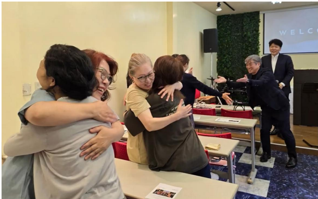
(사진 7) AICC의 예배 중 성도의 교제

AICC의 관계적 소통은 예배 의식의 변화에서 가시화된다. '성도의 교제' 시간에 참여자 모두가 일어나 서로 손을 맞잡고 눈을 마주치며 '주님의 평화'를 의미하는 '슈노헤이와(主の平和)'라고 인사하는 의식은, 신앙이 하나님과의 수직적 관계뿐 아니라 이웃과의 수평적 관계임을 몸으로 체현(embody)하는 행위이다.