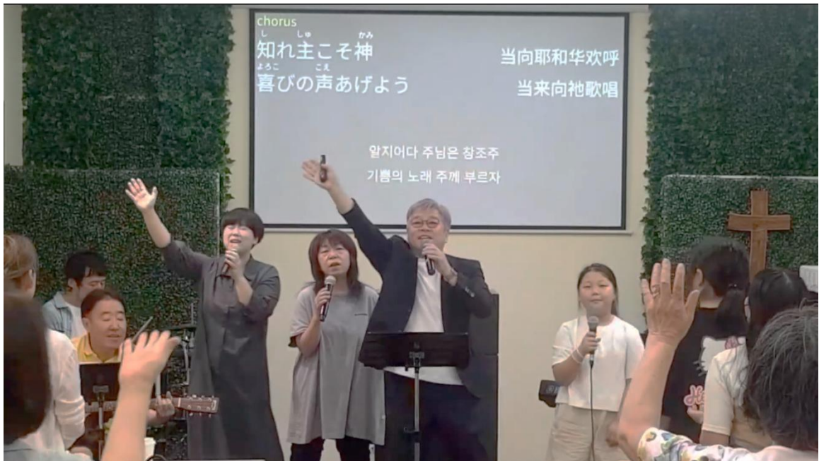
(사진 8) 여러 언어로 가사를 제공하는 AICC 경배와 찬양 시간

또한 매 예배마다 찬양 가사, 시편 교독, 성경 봉독은 세 가지 언어 이상으로 제공되며, 일본어를 이해하지 못하는 교인들을 위해 설교 원고가 6개 언어로 번역 출력된다. 이는 특정 언어와 문화의 우월성을 전제로 타자를 동화시키려는 식민적 모델을 탈피하려는 의도의 표현이다.