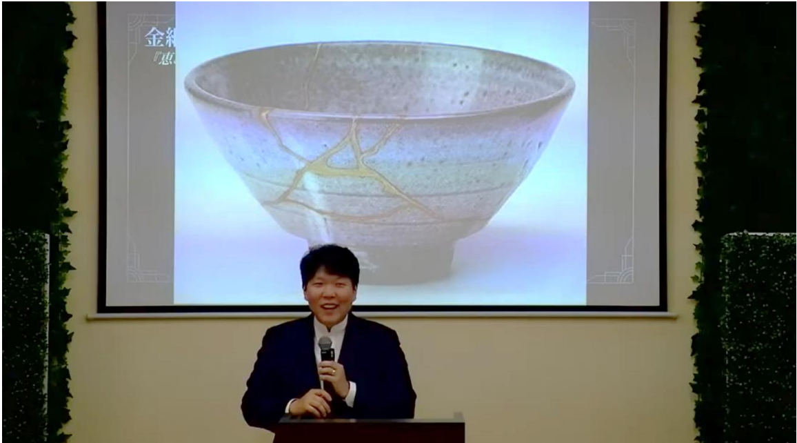
(사진18) 설교 중 일본 전통공예 킨츠기(金繼ぎ)를 통해 '증인된 삶'을 비유

놀랍도록 조용한다. 킨츠기 이미지는 '죄인 된 우리'라는 결핍과 상처가 하나님의 은혜(금)를 통해 오히려 아름다운 하나님의 걸작으로 재창조된다는 메시지를, 일본인의 심층 미의식에 호소하며 전달한다.