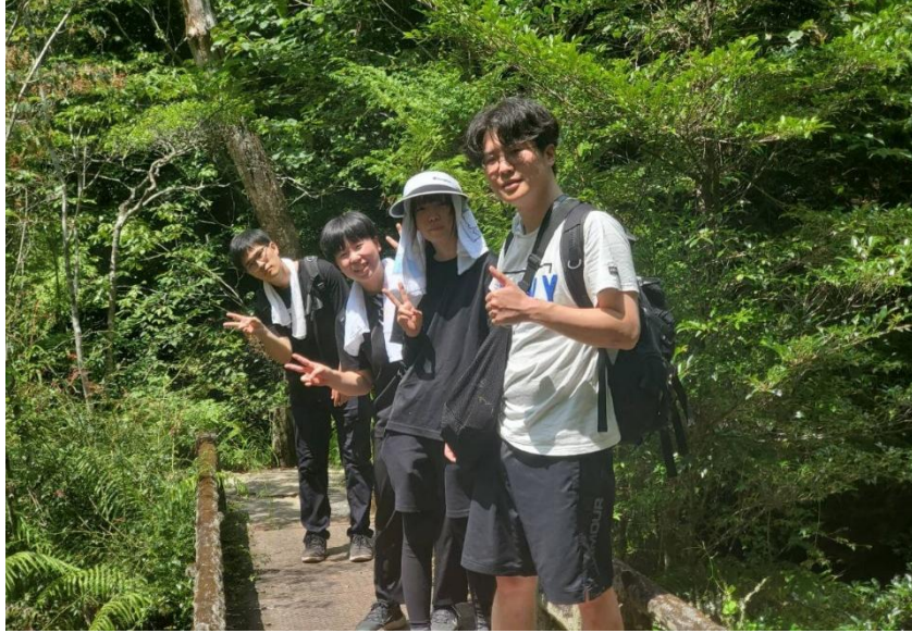
(사진 24) 청년들과 관계 속에서 전달하는 복음

통해 청년들은 자신들의 일상적 삶이 하나님의 이야기와 연결되어 있음을 자각하며, 그들을 통해 하나님의 복음이 세상과 연결되어 있음을 기억하게 된다.