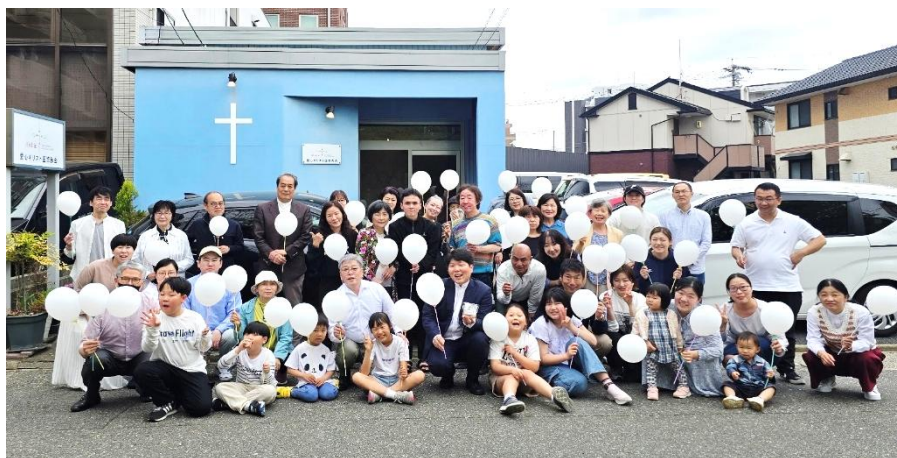
(사진 23) 하얀색 풍선(부활의 기쁨)과 함께 세상으로 파송