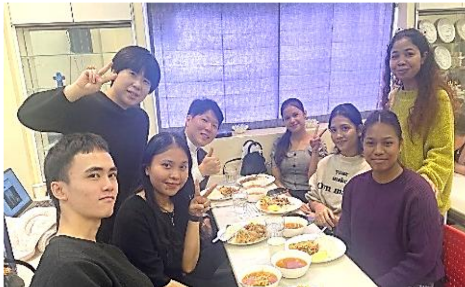
(사진 5) 기능실습생 성경회

둘째, 취약 계층을 위한 맞춤형 선교이다. 일본은 초고령 사회(Super-aged Society)에 진입했으며, 노동 가능 인구가 급격하게 줄어들고 있다. 83 사회 기간시설을 유지하기 위해 ‘기능실습생’이라는 노동자 신분으로 상당 수의 외국인들이 일본에 거주하도록 정책적으로 지원하고 있다. AICC는 나고야 지역의 제조업 밀집 특