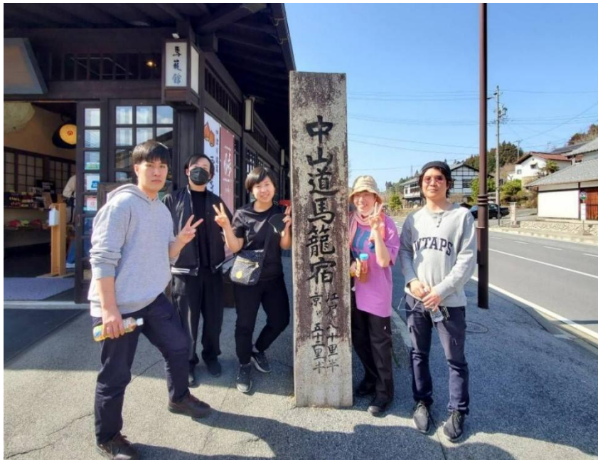
(사진 25) 청년들과 세상과 연결되는 복음을 알리는 소풍

이러한 AICC의 접근은 레너드 스윗이 제시한 연결성의 네 가지 차원과 조응한다. 첫째, 하나님과의 연결(Vertical Connection) 이다. 예배와 기도,