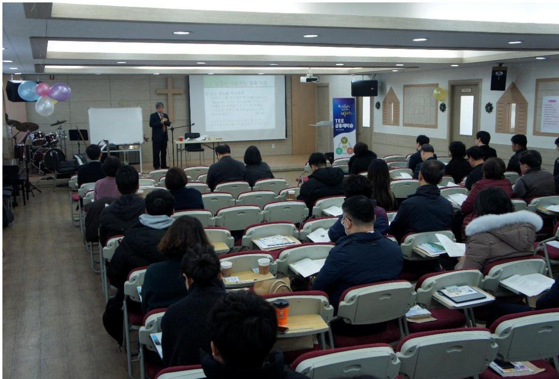
[그림 5-6. 2019년도 TEE 목회자세미나 진행사진]