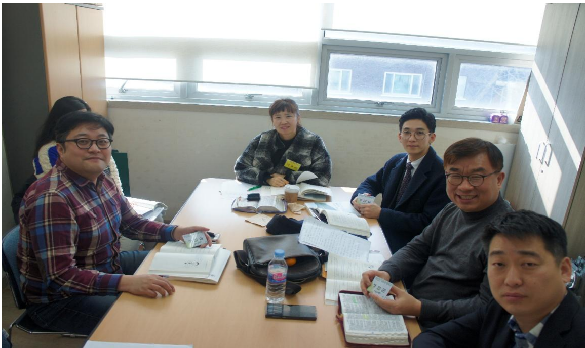
[그림 5-8. 이론 교육 이후 소그룹 실습사진 2]