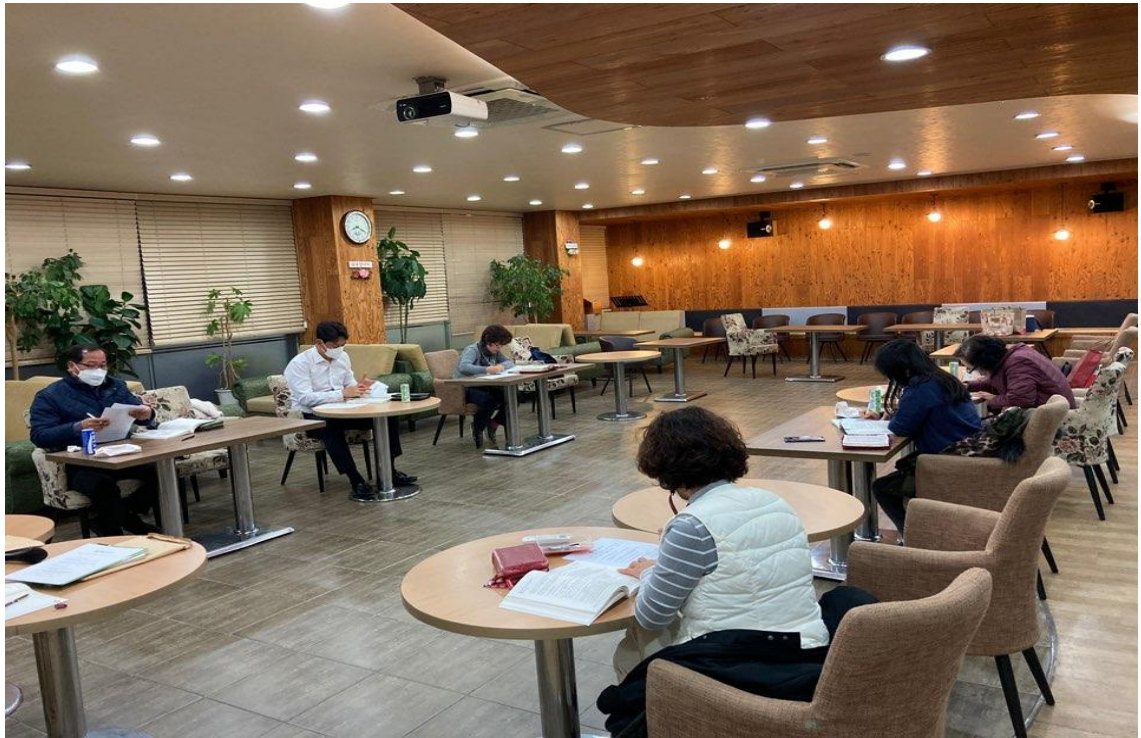
[그림 5-4. 비대면 진행을 위한 인도자 Zoom 교육]

인도자들을 모두 온라인 교육과정을 개설하여 Zoom 교육에 참여시켜 온라인 TEE 소그룹 공동체 학습을 진행했다. 아래는 Zoom 온라인 교육을 진행하는 사진과 실제로 온라인으로 TEE를 진행하는 모습이다(그림 5-4, 5-5).