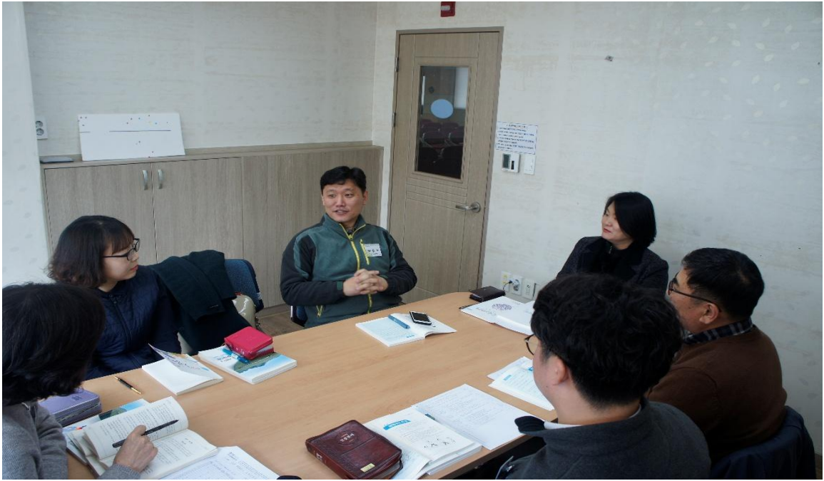
[그림 5-7. 이론교육 이후 소그룹 실습사진]