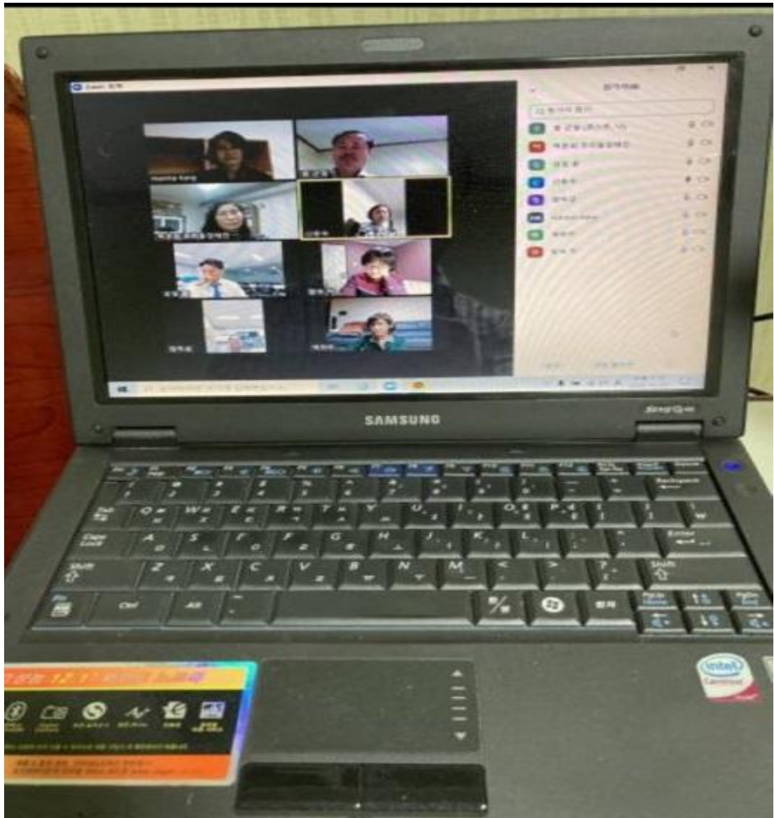
[그림 5-5. Zoom을 통한 실제 비대면 TEE모임]

유성교회는 유성교회 내의 인도자 교육뿐만 아니라 중부 지역의 지도자(목회자) 훈련을 위해 교회의 장소를 제공하고 필요에 따라 훈련을 받은 인도자들의 코치 역할도 담당하였다. 아래는 2019년도 TEE 목회자세미나 194차에 진행된 교육의 모습과 각 반별 실제 인도자 훈련의 실습 모습이 담겨있다(그림 5-6,