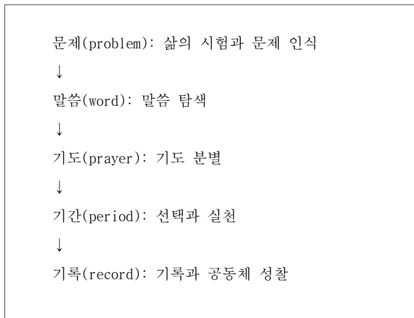
표 4-2. ToF의 실행 구조

ToF의 특징은 신앙을 이론적으로 설명하는 데 머무르지 않고, 구체적인 실행 단위를 통해 삶 속에서 작동하도록 설계되어 있다는 점이다. 이러한 실행 구조는 다음 표 4-5와 같은 반복 가능한 다섯 단계로 정리될 수 있다.