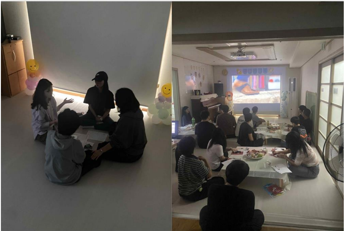
그림 4-2 은 토요 모임 참여 사진이다.

Y 교회 청년부에서 확인된 변화는, 예배를 통해 하나님을 대면한 이들이 세상의 가치 체계가 줄 수 없는 근원적 기쁨을 소유하게 되었을 때, 공동체가 어떻게 선교적이고 유기적인 생명력을 회복할 수 있는지를 명확히 입증해 주었다.