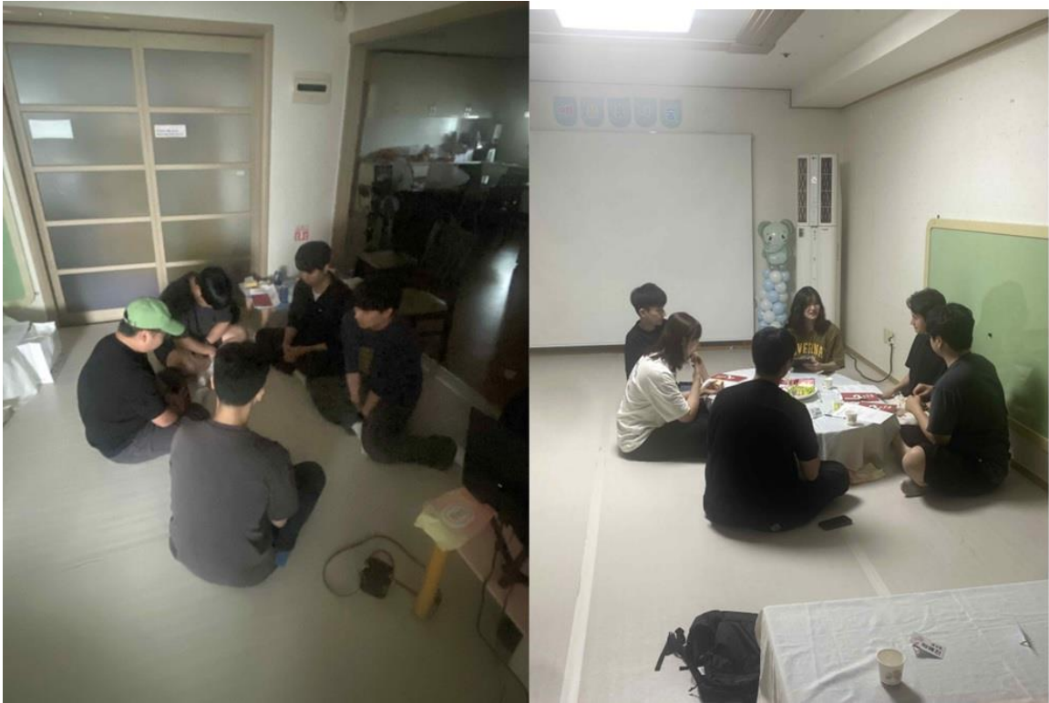
그림 4-2. 토요일 모임